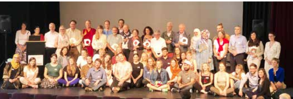
À gauche : Lors de la fête d'inauguration à Fribourg, les partenaires et les guides de la Suisse romande et de Berne et Soleure ont fait connaissance. À droite : À la découverte des gorges de Verena.

La troisième et dernière étape d'élaboration de « Dialogue en Route », en Suisse romande et dans la région de Berne-Soleure, a marqué la mise en œuvre du projet dans l'ensemble de la Suisse. Depuis la fin de l'année 2019, plus de 120 offres permanentes ont été proposées aux classes scolaires et autres groupes.