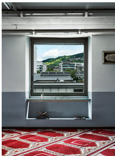
Marwan Bassiouni, New Swiss Views #1, Switzerland, 2021. From the series New Swiss Views .

L'exposition, programmée à l'espace d'art Halle Nord, sera inaugurée par un vernissage et une table ronde publique qui se tiendra le 11 mars à 19 heures , en présence de l'artiste. Cet événement fera dialoguer les perspectives scientifiques, artistiques et religieuses, et abordera notamment les questions des perceptions de l'Islam en Suisse ainsi que la relation du religieux (et du lieu de culte) à son environnement direct. La table ronde sera suivie d'un apéritif. Plus d'informations suivront, réservez d'ores et déjà la date !