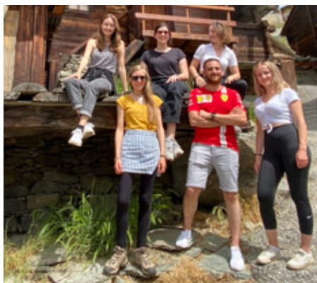
Guides lors d'un team building dans le village de montagne valaisan de Törbel.

Le nombre d'interventions des guides augmente également de façon conséquente. En effet, les 83 guides ont assuré cette année 315 missions ; 186 de celles-ci correspondent à l'animation de nos offres. En Suisse alémanique et en Suisse romande, une formation obligatoire certifiée, respectivement par la HEP Lucerne et la HEP BEJUNE, a été organisée à nouveau. Les formations continues internes constituent quant à elles un moyen important pour les guides de se rencontrer et d'exercer leurs compétences en matière de médiation. C'est ainsi qu'ont eu lieu par exemple un week-end de team building dans le village valaisan de Törbel, incluant une visite guidée du village et une visite du centre de retraite bouddhiste « Kailah », des ateliers sur l'art et la politique, la « Cityoenneté » ou le sexisme.