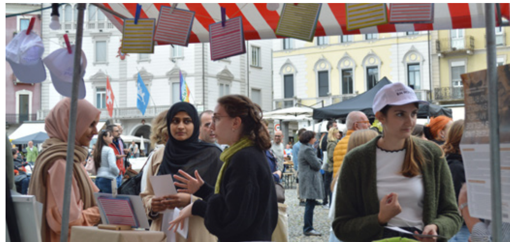
Les passant-e-s découvrent le projet lors d'un stand à la « Festa dei popoli ».

L'année 2022 marque une année de fonctionnement particulièrement stable pour « Dialogue en Route ». Avec un financement largement assuré, les objectifs du projet ont été atteints avec succès. Une équipe polyvalente, des guides actif-ve-s et une large palette d'offres scolaires et extrascolaires ont permis de répondre aux différents besoins des classes.