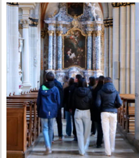
Une classe visite la cathédrale de Fribourg.